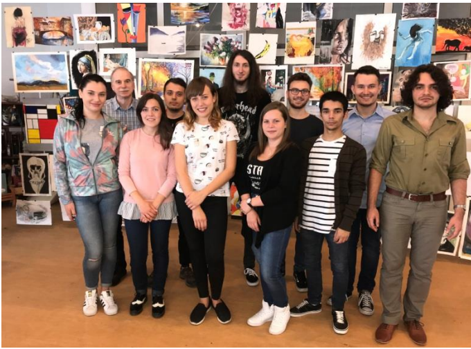
Participanții UTBv/DPM/ID împreună cu coordonatorul lor